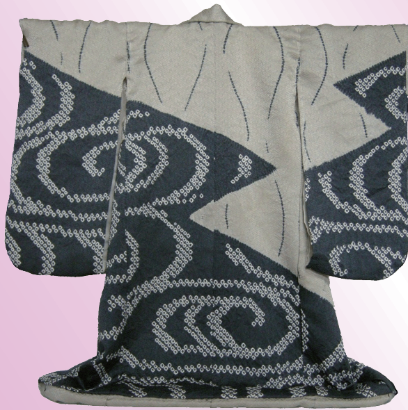
ありまつしほ まつかわかん ぜ みずもんようふりそで 有松絞り松皮観世水文様振袖