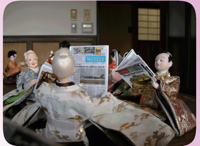
国際化の進むお雛様の世界