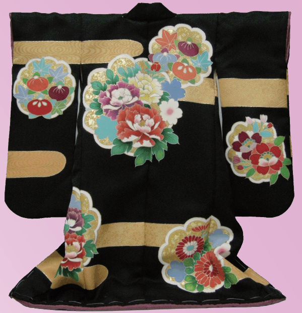
なごやてが ゆうぜんくろじ きんくもど しき はなもんようふりそで 名古屋手描き友禅黒地に金雲取り四季の花文様振袖