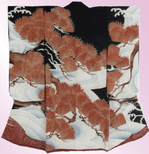
くろちりめん じししょうかりゆうすい めんようふりそで 黒縮緬地松下流水図文様振袖